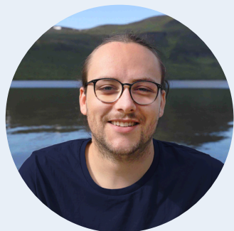
Fabio König Volontärfotograf