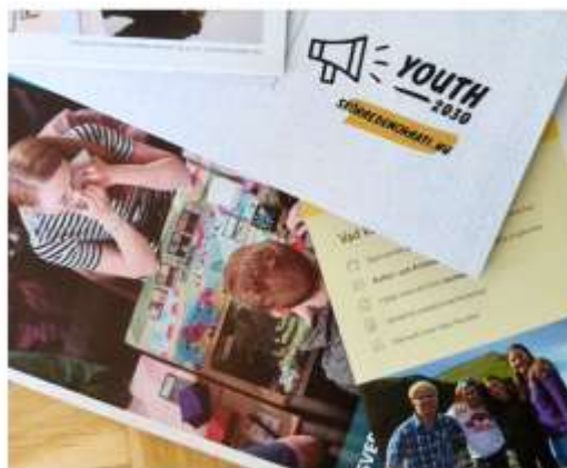
Youth Up North.